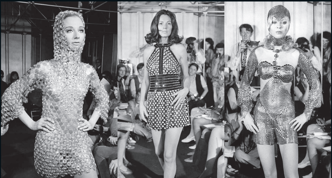
Paco Rabanne fue excéntrico, místico y futurista