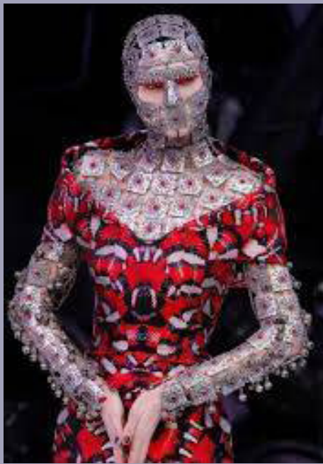
2- Alexander McQueen