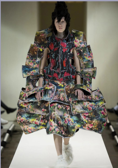
4- Vivienne Westwood