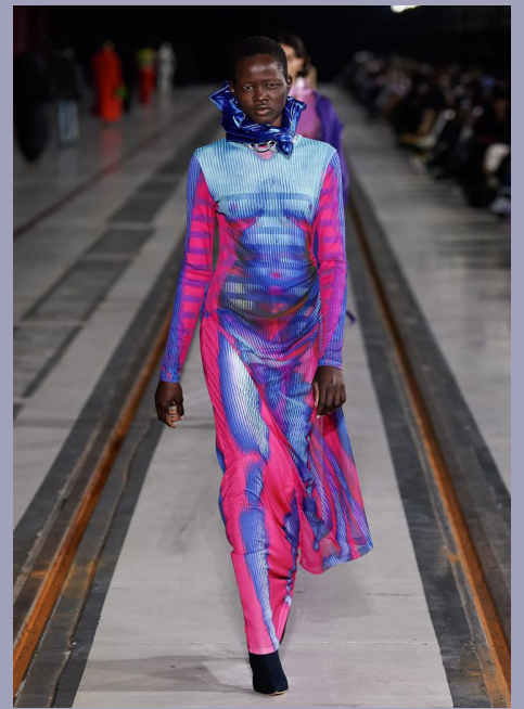
3- Jean Paul Gaultier