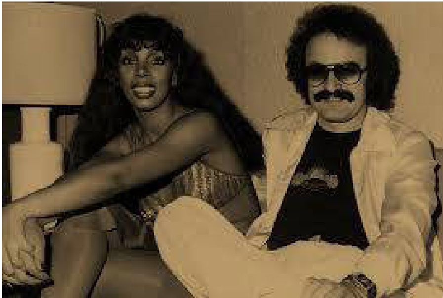
Donna Summer y Giorgio Moroder iniciadores de la musica electronica

Explora la era donde los sintetizadores y los ritmos hipnóticos definieron una nueva estética, fusionando el brillo de la música disco con una audaz visión del mañana.