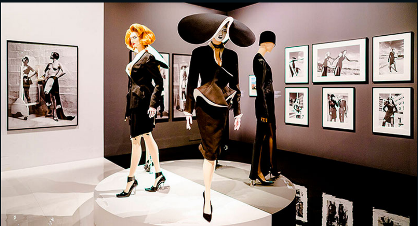
Thierry Mugler exposición en París 2022