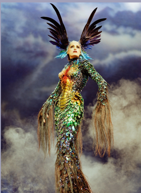
7- Thierry Mugler

"Tu propuesta debe reflejar esa estética que imaginaba el mañana desde un ayer lleno de innovación y estilo"