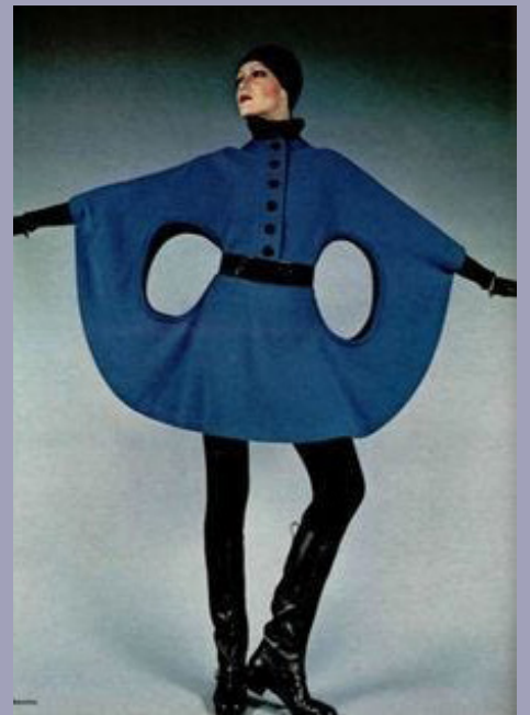
6- Pierre Cardin